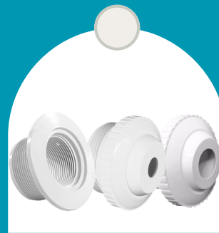
ADAPTADORES DE RETORNO