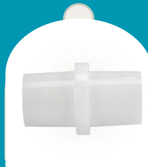
CONECTOR PARA MANGUERA