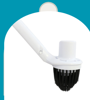
CEPILLO ESQUINERO PARA PISCINA