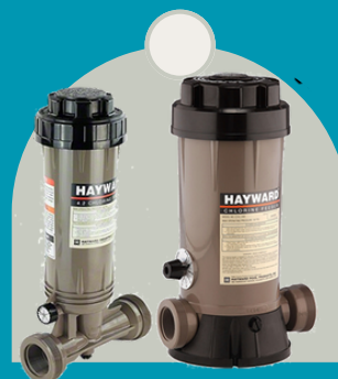
CLORINADOR 100 CL 200 CL