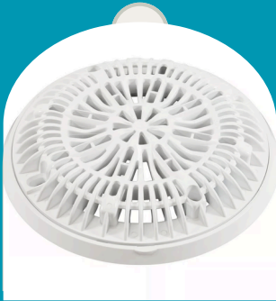
TAPA PARA DRENAJE DE PISCINA