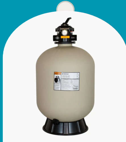
Filtro de Arena Pentair