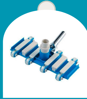
ASPIRADORA DE 8 RODOS