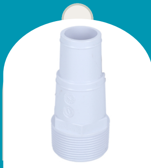
ADAPTADOR DE MANGUERA