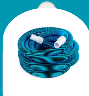
MANGUERA PARA PISCINA 25 PIES 30 PIES 50 PIES