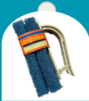
ESPONJA LIMPIA BORDES CON REPUESTO