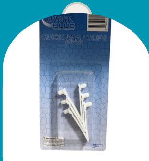
REPUESTO DE ASPIRADORA