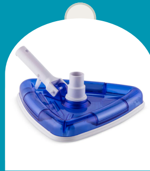
ASPIRADORA TRIANGULAR PARA PISCINA ARMABLE