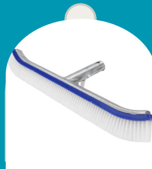
CEPILLO DE CERDAS PLASTICAS