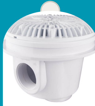
DRENAJE DE PISCINA