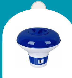
FLOTADOR PARA PASTILLAS