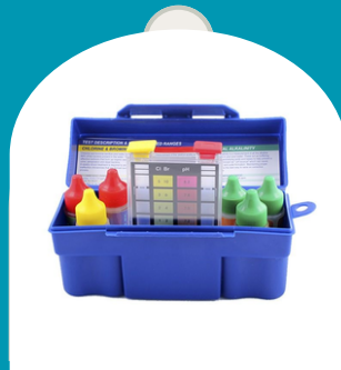
KIT DE PRUEBA DE PISCINA 5 ETAPAS PARA PROBAR CLORO TOTAL, BROMO TOTAL, pH, DEMANDA DE ACIDO Y ALCALINIDAD TOTAL