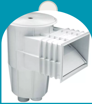
SKIMMER PARA PISCINA