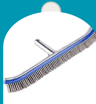
CEPILLO DE CERDAS DE METAL