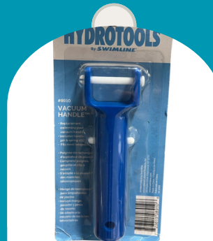
REPUESTO MANGO ASPIRADORA PLASTICO