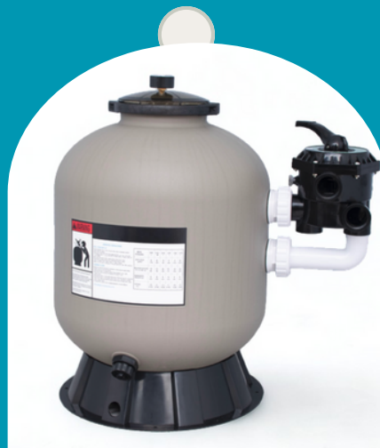
Filtro de Arena Genérico

1 Use standard #20 silica sand * Required clearance to remove the valve ** Maximum flow rate *** SD 80 available with 1½" or 2" valve